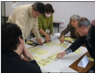
＜グループで話し合いをまとめている様子＞

そのときに各グループで発表して頂いた意見等を今後まとめている、平成24年度の推進月間で男女共同参画ビジョンとしてポスターを作成・掲示する予定です。出来上がりを楽しみにしてください。