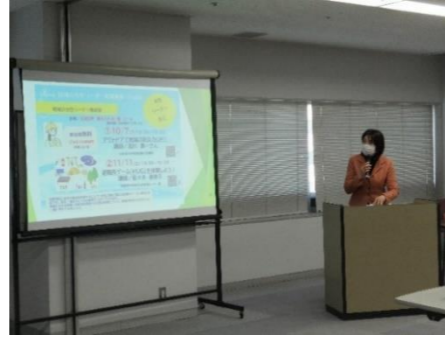
「地域の女性リーダー応援事業」報告会の様子