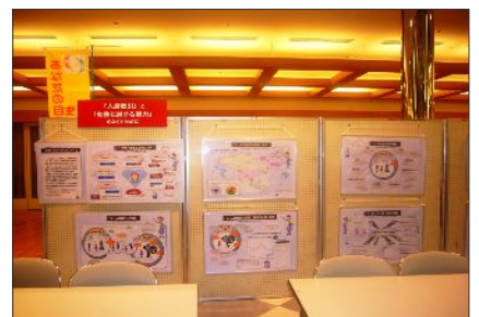
又エック提供の「人身取引と女性に対する暴力をなくすために」パネル展示