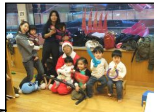
クリスマス会も盛り上がったよ!