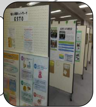
パネル 展 示