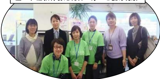
国立女性教育会館職員の方々と記念撮影

進の取り組み、事業、活動について、和やかな中にも真剣なやり取りが続きました。中でも福岡市の方から、「各小学校の校区に“校区男女共同参画協議会”があり、委員が活動している。」とのお話をお聞きし、早い段階で参画意識を育てることの必要性をあらためて考えさせられました。開幕前日から最終日まで、普段は遠くに暮らし、出会うことのなかった方々と語り合えたことは、会議の一つの成果としてスタッフ全員の心に刻まれています。