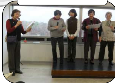
登録団体活動紹介