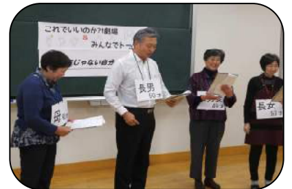
「これでいいのか?!劇場」