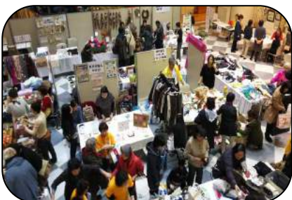
ふれあいマーケット