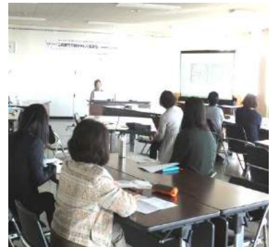
菊地さんの話を熱心に聞く参加者