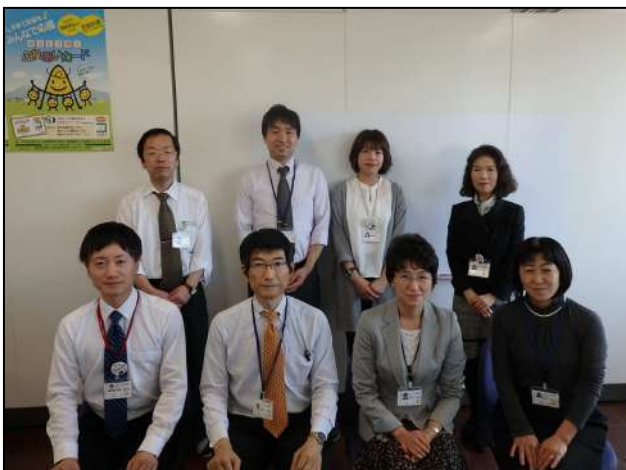
次世代・女性活躍支援課 女性活躍・両立支援班の皆さん

こうした取組は地域や市町村などとも連携を図りながら進めてまいります。全ての県民が生きがいを持って豊かに暮らせる社会の実現に向け努力してまいりたいと思っておりますので、皆様の御理解と御協力をお願いいたします。