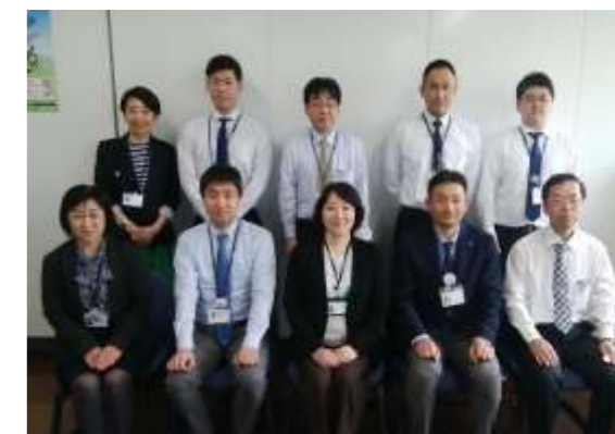
あきた未来創造部次世代・女性活躍支援課の皆さん

結びに、当センターは、地域における男女共同参画社会の実現に向けた拠点として、今後も県民のニーズや時代にマッチした事業を展開してまいりますので、皆様には引き続きセンターの御利用とともに、運営への御協力をお願いいたします。