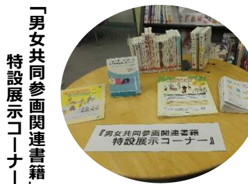
「男女共同参画関連書籍」特設展示コーナー