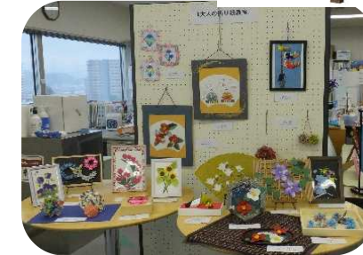
センター利用者、登録団体の作品展示