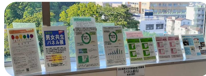
男女共生パネル展示(6/20~7/4)