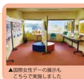
▲国際女性デーの展示もこちらで実施しました